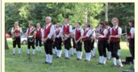
Die Luftenberger Marktmusik bei der Donaukreuzmesse

Als Erinnerung an die gemeinsamen Stunden des Lebens und als Dank wird der alljährliche Gedenkgottesdienst den verstorbenen Freunden und Förderern beider Vereine gewidmet.