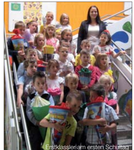
Erstklassler am ersten Schultag

Weitere Details zur Veranstaltung (und Anmeldemöglichkeiten) werden in den Schulen verteilt. Über eine zahlreiche Teilnahme – besonders auch von den neu hinzugekommenen Kindern und Eltern – freuen sich die Mitglieder des Elternvereins.