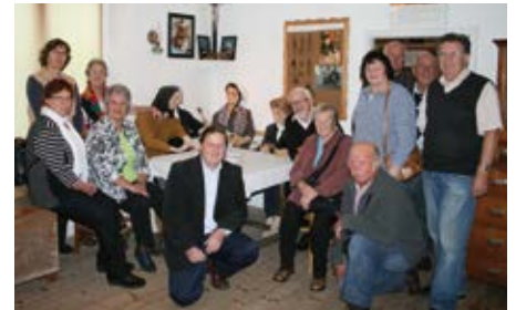
Die Kardenstube in Katsdorfer Museum