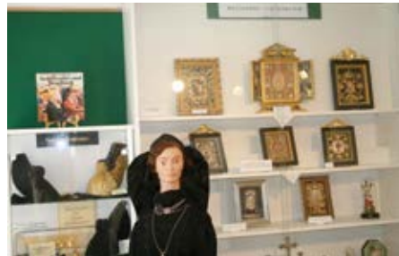
Sonderausstellung kirchliche Volkskunst