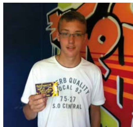
Die Tombola-GewinnerInnen von Freiluftgewitter-Konzertkarten