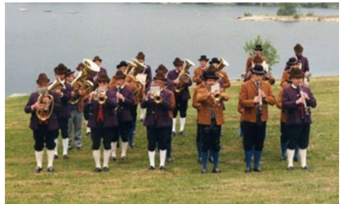
Trachtenkapelle bei der Brückenweihe Mitterwasser 1988