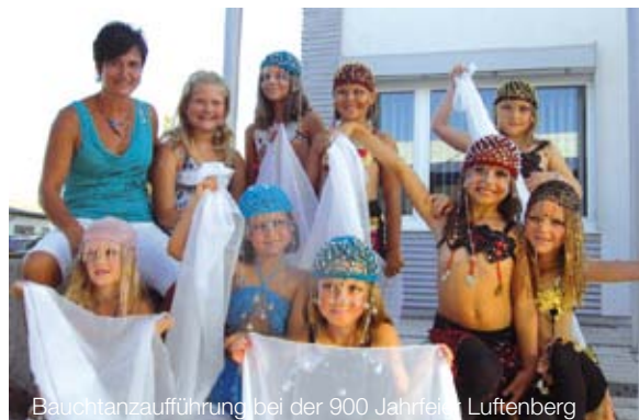
Bauchtanzaufführung bei der 900 Jahrfeier Luftenberg