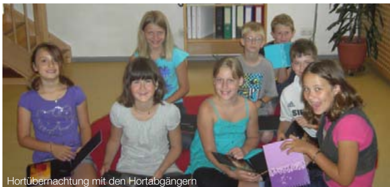
Hortübernachtung mit den Hortabgängern