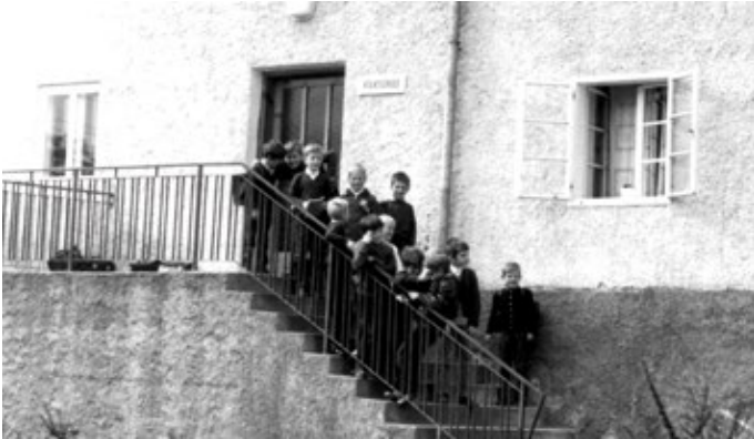
Luftenberger Volksschüler vor dem Haus der Fam. Weiß / Kutzenberger

Volksschule in Form von zwei dislozierten Klassen der VS St. Georgen/Gusen beim Kutzenberger eingerichtet.