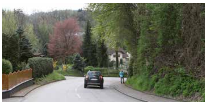
Kutzenbergstraße Richtung Weih heute auf Höhe der Liegenschaft Kotek Foto: Edeltraud Schwarz 2016

Falls Sie liebe Freunde und Gönner unseres HV noch alte Bilder/Fotos von Luftenberg besitzen, bitten wir Sie uns diese zur Reproduktion leihweise zur Verfügung zu stellen. (Tel.: 067761458584)