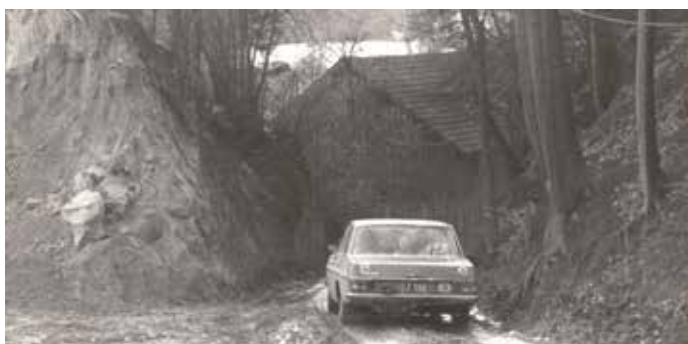
Kutzenbergstraße Richtung Weih um 1966 Lagerschuppen der Gärtnerei Aichhorn