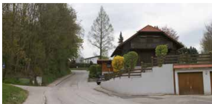
Kutzenbergstraße heute rechts das alte Haus Aichhorn Liegenschaft Leonhardsberger Foto: Edeltraud Schwarz 2016