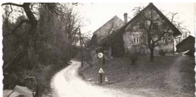
Kutzenbergstraße (ehem. Hohlweg) 1969 rechts das alte Haus Aichhorn

der Gemeindeentwicklung wird dann in geeigneter Form veröffentlicht werden. Nachfolgend zwei Beispiele: