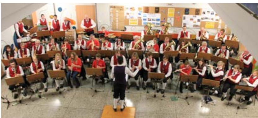
Kids & Co spielen gemeinsam mit der Marktmusik

Auch hier werden die Spenden für die Anschaffung der überfälligen Lederhosen verwendet.